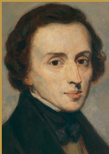
FRÉDÉRIC CHOPIN (1810-1849)