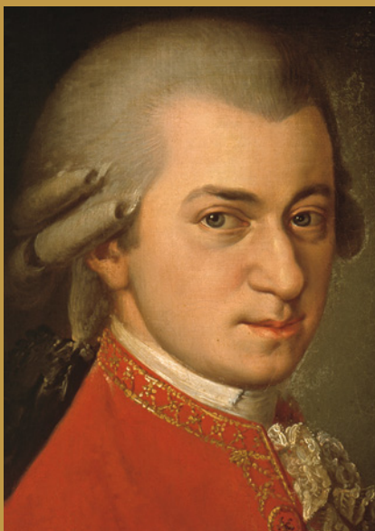
W. A. MOZART (1756-1791)